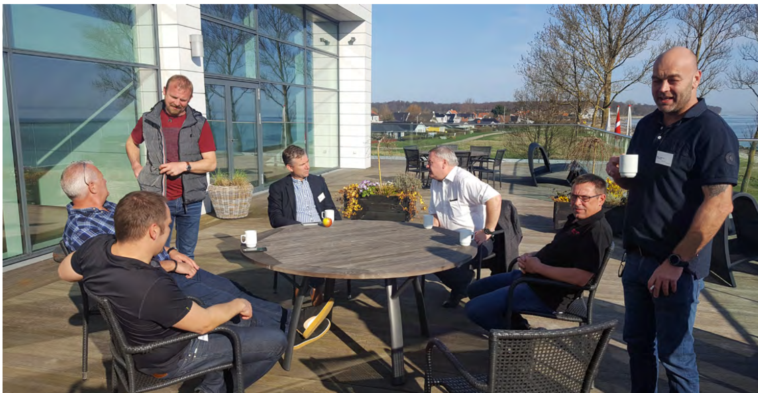
Forårssolen havde et solidt tag i de fremmødte. 48 af sektionens medlemmer mødte op på Storebælt Sinatur Hotel og de nød morgenbuffeten på tagterrassen

Solens stråler smilede allerede i april venligt til de mange fremmødte til årets generalforsamling i Stilladssektionen . Måske som et klap på skuldrene for det arbejde sektionen og dens medlemmerne gør for at blive anerkendt som en central medspiller i byggeriet