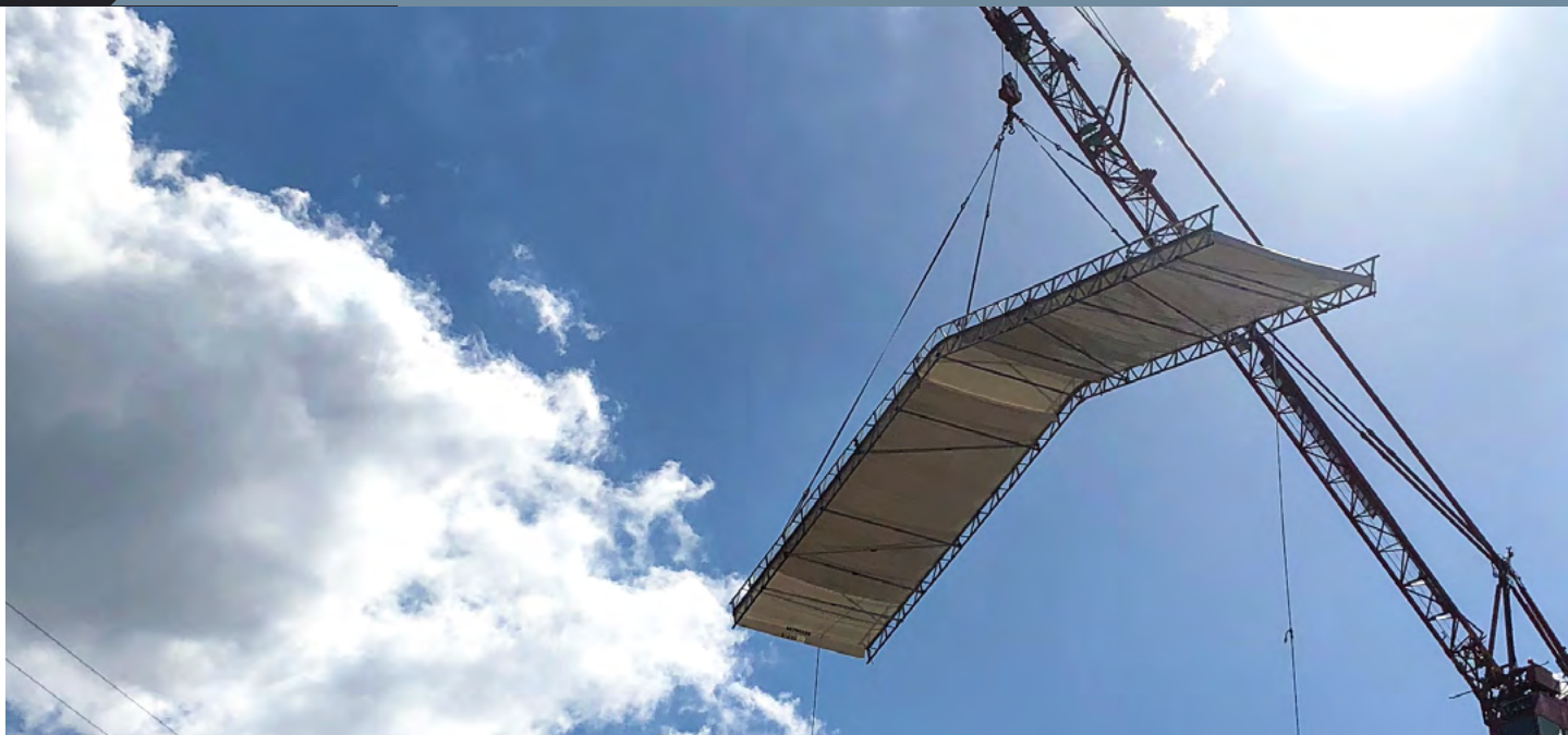
Stilladsoverdækning på Østerbro i København, Bryggens Stilladser