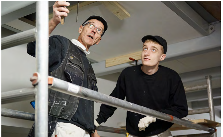
Stilladsbranchen yder en stor uddannelsesmæssig indsats og uddanner mange stilladsmontørel elever på AMU-kontraktuddannelsen, men kun elever fra de traditionelle erhvervsfaglige uddannelser tæller med i trepartsaftalen

Og Solrød Stilladser står ikke alene. Det skaber naturligvis modvilje i mange stilladsvirksomheder, at de nu skal betale på linje med de mange virksomheder, der ikke løfter en uddannelsesopgave. Det er velkendt, at stillads-